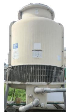
※こちらはイメージです。