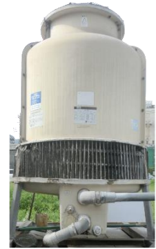
※こちらはイメージです。